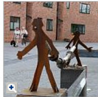
Eine ellenlange Leitung von mensch zu Mensch versinnbildlicht diese Skulptur von Margret Zimpel und Andrea Schneider. Sie wurde beschädigt

„Kunst drinnen und draußen“, heißt ein Projekt der „Initiative Kunst Hennef“, die erstmalig Objekte in der Stadt aufgestellt hat. Noch bis zum September sollen die Werke das Stadtbild gestalten.